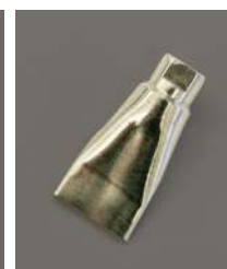
MCD-14A ノズル先端 20×0.5