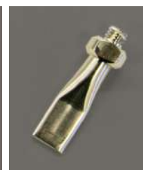
MCD-11A ノズル先端 7×0.5