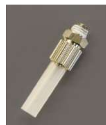
MCD-10A ノズル先端 2.5φ