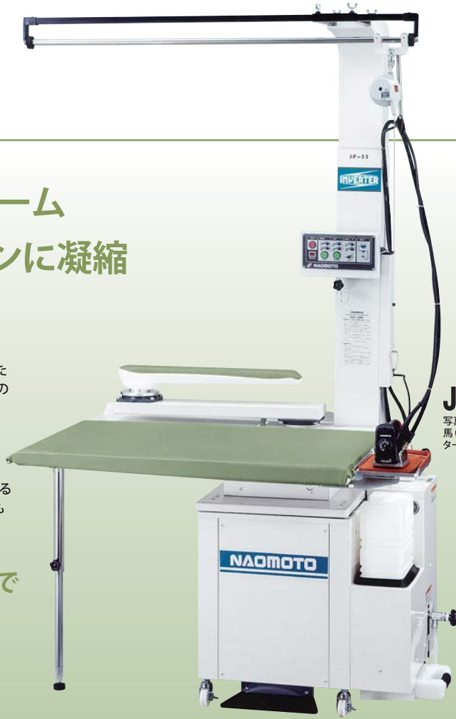
JF-56 写真は、仕上台 (JF-56)、 馬 (M-220)、アイロンリフ ターのセットアップ例です。

インバータ制御で平台は回転数1600~3000RPMに、馬は2000~4000RPMの間に、自由に設定可能。 素材ごとの変化にもキメ細かく対応して能率UP。