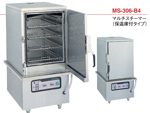
MS-306-B4 マルチスチーマー (保温庫付タイプ)